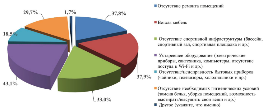
Рисунок 4 — Распределение ответов на вопрос «Какие параметры материально-технического обеспечения и уровня развития инфраструктуры учреждения вызвали у ребенка недовольство?», процент от общего числа опрошенных, не удовлетворенных качеством материально-технического обслуживания и развития инфраструктуры.