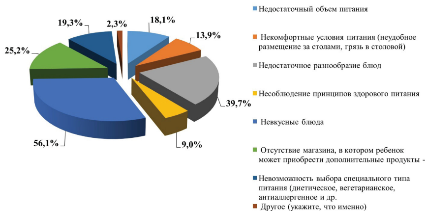
Рисунок 2 — Распределение ответов на вопрос «Какие параметры организации питания вызвали у ребенка недовольство?», процент от общего числа опрошенных, не удовлетворенных качеством питания.

Figure 1 — Distribution of answers to the question “How satisfied was your child with the quality of food during rest?” depending on the organizational and legal form of the children’s recreation institution, in % of the total number of respondents.