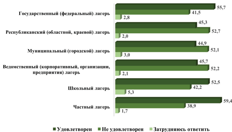
Рисунок 1 — Распределение ответов на вопрос «Насколько Ваш ребенок был удовлетворен качеством питания во время отдыха?» в зависимости от организационно-правовой формы учреждения детского отдыха, процент от общего числа опрошенных.

Figure 1 — Distribution of answers to the question “How satisfied was your child with the quality of food during rest?” depending on the organizational and legal form of the children’s recreation institution, in % of the total number of respondents.