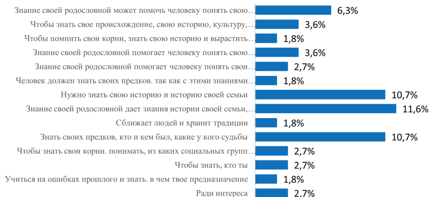
Рисунок 1 — Ответы на вопрос: «Как вы считаете, зачем человеку знать свою родословную?», %.