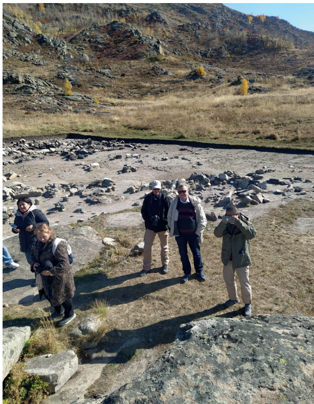
Рис. 2. Экскурсия в историко-культурном комплексе «Акбауыр» (фото автора)

Этнографический и исторический виды туризма также развиваются в ВКО, чему способствует наличие 348 памятников культуры в регионе.