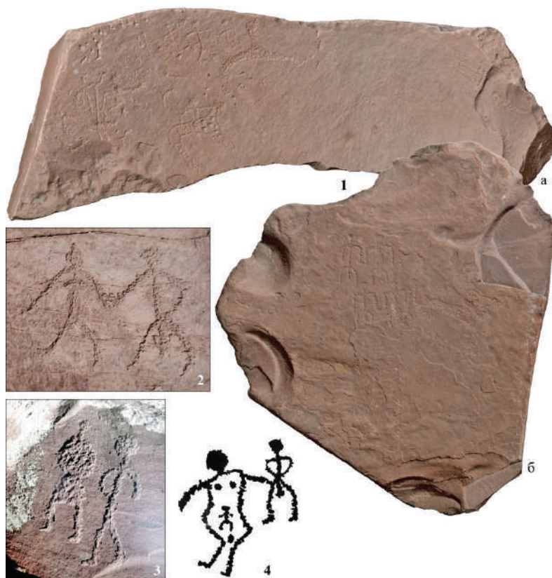
Рис. 1. Сцены с изображениями антропоморфных фигур: 1 — Оглахты, фонды музея КемГУ (КМАЭЭ ОФ 45/86, ГК 40139811 (а); КМАЭЭ ОФ 45/87, ГК 40139810 (б)), рендер модели, RSSDA; 2, 3 — Оглахты, фото по: (Наскальные изображения Оглахты, 2017, с. 155–157); 4 — Оглахты, прорисовка О.С. Советовой

вестный сегодня материал позволяет разделить фигуры животных на линейные, силуэтные и контурные. При этом для последних характерен как простой контур, так и усложненный орнаментацией. Большое количество орнаментированных коней зафиксировано на скалах Оглахты, что отличает этот памятник от всех известных в Минусинской котловине.