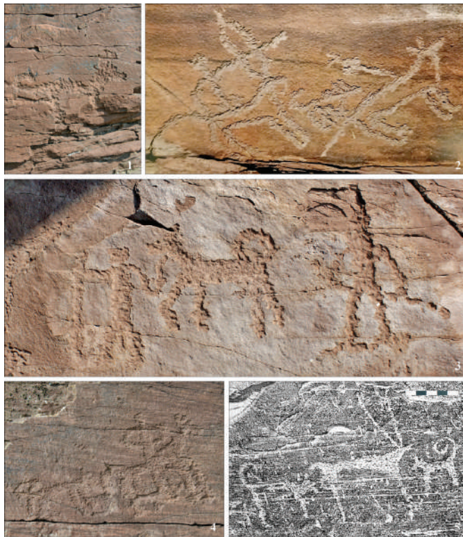
Рис. 5. Сцены с изображениями собак: 1, 4, — Тепсей; 2 — Оглахты, по: (Наскальные изображения Оглахты, 2017, с. 127); 3 — Улазы; 5 — Усть-Туба (микалентная копия О.С. Советовой)