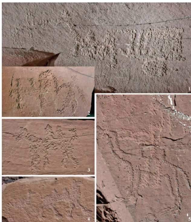
Рис. 4. Сцены с изображениями верблюдов: 1 — Усть-Туба, фото И.В. Аболонковой; 2 — Оглахты, по: (Наскальные изображения Оглахты, 2017, с. 93); 3, 4 — Улазы, фото А.Н. Мухаревой; 5 — Георгиевская, фото А.Н. Мухаревой

гурки человечков на гигантские изображения коней, нанесенных, вероятно, в конце тагарской эпохи на скальные плоскости Усть-Тубы (рис. 3.-1). Также среди рисунков Оглахты известно множество примеров «творческого» использования хакасами ранних композиций, когда в тагарские сцены добавлялись фигурки людей (нередко это разнополюе антропоморфные пары, всадники), животные, знаки и т.д. (Наскальные изображения Оглахты, 2017, с. 74, 82, 102, 110). Одна из оглахтинских сцен была совершенно преобразована хакасским художником, когда он к фигурке оленя, выполненного в скифском стиле, подрисовал еще одну достаточно неказистую фигурку животного и между ними вписал антропоморфную фигуру, таким образом как бы воссоздав сюжет с «господином коней», а между этим скифским оленем и нижерасположенным таким же оленем (оба в позе с подогнутыми ногами) расположил две фигурки людей, взявшихся за руки (Советова, 2005, рис. 11А; Наскальные изображения Оглахты, 2017, рис. на с. 82, фрагмент). На Тепсее в сцене с «великанами» позднее были подбиты некоторые фигурки всадников, человечков, а также собака с характерным закрученным хвостом (Советова, Шишкина, Аболонкова, 2021, кат. 477).