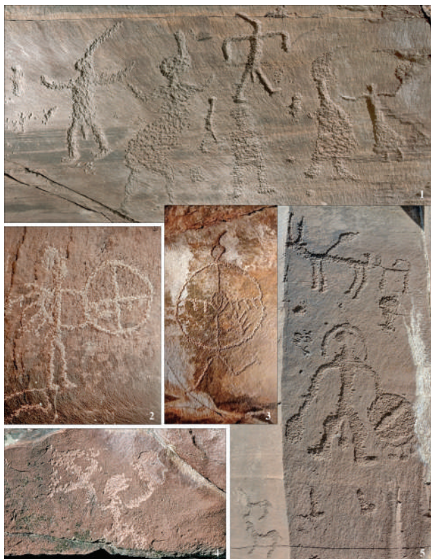
Рис. 2. Изображения шаманов: 1, 4 — Усть-Туба, фото И.В. Аболонковой; 2, 3 — Оглахты, фото по: (Наскальные изображения Оглахты, 2017, с. 138, 139); 5 — Ильинская писаница, фото А.Н. Мухаревой Fig. 2. Images of shamans: 1, 4 — Ust-Tuba, photo by I.V. Abolonkova; 2, 3 — Oglakhty, photo by: (Rock paintings of Oglakhty, 2017, pp. 138, 139); 5 — Ilyinskaya petroglyphs, photo by A.N. Mukhareva

ных. Кони встречаются как одиночными, так и в многофигурных сценах: нередко они сопровождают своего хозяина, который либо восседает на нем, либо расположен рядом. Порой в таких сценах показаны и собаки с хвостами-колечками, бегущие за конем (рис. 3.-2). Кони могут быть впряжены в повозки, на их спинах перевозят скарб либо перемещаются люди (перекочевка?). Особую группу представляют кони с маленькими антропоморфными фигурками на спинах (рис. 3.-1).