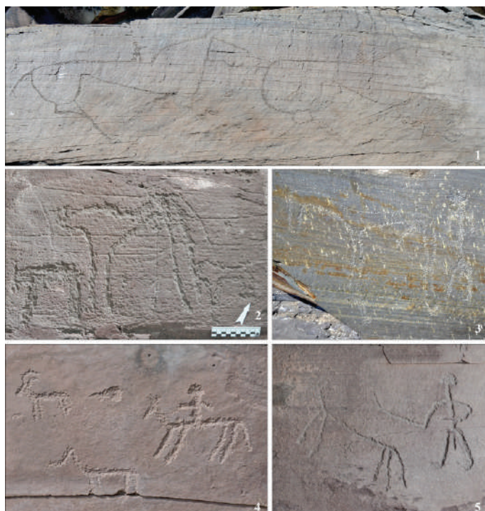
Рис. 3. Сцены с изображениями коней: 1, 3 — Усть-Туба, фото И.В. Аболонковой (1) и О.С. Советовой (3); 2 — Тенсей, фото И.В. Аболонковой; 4 — Улазы, фото А.Н. Мухаревой; 5 — Фунтикова, фото А.Н. Мухаревой

горе Георгиевской и других памятниках (рис. 4). Некоторые фигуры изображены очень реалистично, другие — предельно схематично. На одной из усть-тубинских сцен верблюд тащит повозку, по виду похожую на хакасскую (Бутанаев, 1996, с. 48) (рис. 4.-1). Учитывая, что разведение верблюдов на территории Минусинской котловины прекратилось в XIX в., а заселение русскими данной территории произошло в XVIII в., можно предположить, что изображение могло быть выполнено в пределах этих хронологических границ.