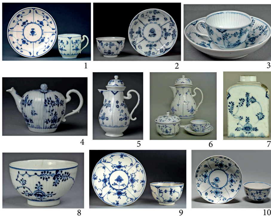
Рис. 3. Фарфор с узором «соломенные цветы» середины XVIII–XIX в. из музейных собраний Европы: 1–5, 8–10 — музей Виктории и Альберта; 6 — музей замка Йевер; 7 — ГИМ. Место производства: 1 — Турне (рег. № 3410&A-1853); 2–5 — Мейсен (рег. № 133&A-1872, № С. 64 и А-1909, № С.97:1, 2–2006, № С. 774&A-1917); 6 — Валлендорф (инв. №№ 01337, 00645, 00251, 00252); 7 — Берлинская королевская фарфоровая мануфактура (ГКМФРФ. № 21221809; № по КП (ГИК): ГИМ 61356/1963; инв. № 6990 фф); 8 — Лоустофт (рег. № С. 668–1920 гг.); 9 — Цюрихская фабрика фаянса и фарфора (рег. № С. 8&A-1969); 10 — Лимбах (рег. № С. 648 и А-1920)

зая Москвы (Россия) 18 и Метрополитен музея Нью-Йорка (США) 19 присутствует значительное количество чайной посуды (чашки, пиалы, блюдца, тарелки, кофейники, чайники, сахарницы, чайные банки и др.) с орнаментом «соломенные цветы» (как с рифлением, так и без), произведенные в Европе в период с середины XVIII до середины XIX в. Это продукция следующих европейских фабрик: Meissen, Limbach, Rauenstein, Wallendorf, Grossbreitenbach, Lowestoft, Tournai, Kalk, Volkstedt, Zürich, Ilmenau и др. (рис. 3).