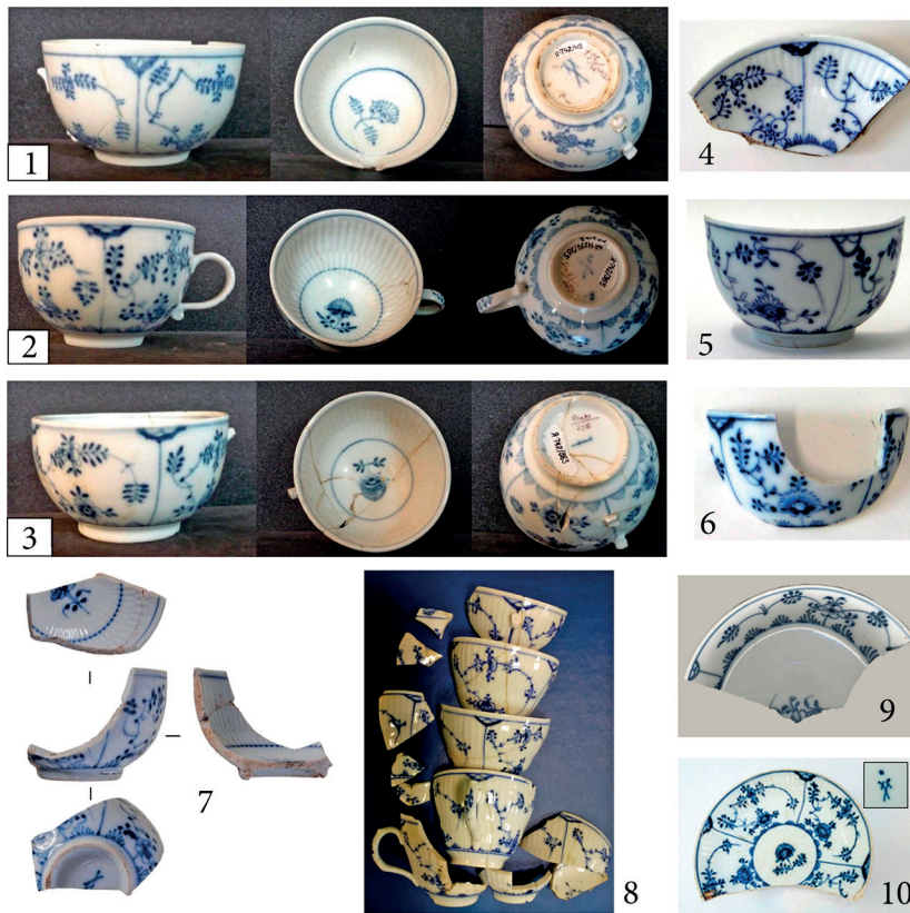
Рис. 2. Фарфор с узором «соломенные цветы», обнаруженный в ходе археологических раскопок на территории РФ: 1–3 — МГОМЗ (ГКМФРФ. № 6122081, 5689501, 5689519); 4–6 — МАУК МИЕ (ГКМФРФ. № 4191116, 41911428, 41911090); 7 — СПб ГБУК «Государственный музей истории Санкт-Петербурга» (ГКМФРФ. № 51006996); 8 — ГБУК Архангельской области «Музейное объединение» (ГКМФРФ. № 20157754); 9 — ФГБУК «Государственный Эрмитаж» (ГКМФРФ. № 7867262); 10 — московская находка (по: Фарфоровое наследие..., 2024)

Fig. 2. Porcelain with a "straw flowers" pattern discovered during archaeological excavations in the territory of the Russian Federation: 1–3 — MGOMZ (GKMFRF. № 6122081, 5689501, 5689519); 4–6 — MAUK MIE (GKMFRF. № 4191116, 41911428, 41911090); 7 — SPB State Museum of the History of St. Petersburg (GKMFRF. № 51006996); 8 — State Budgetary Cultural Institution of the Arkhangelsk Region "Museum Association" (GKMFRF. № 20157754); 9 — Federal State Budgetary Cultural Institution "State Hermitage Museum" (GKMFRF. No. 7867262); 10 — Moscow find (according to: Porcelain heritage..., 2024)