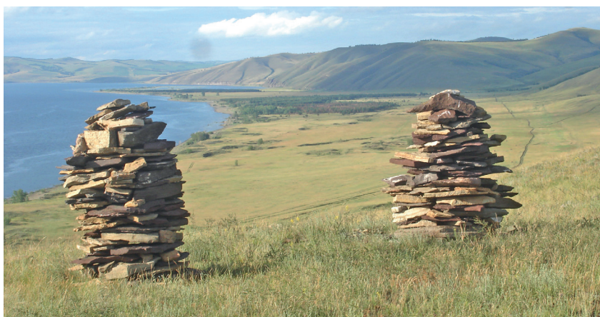
Рис. 2. Обо на вершине отрога Тепсей Fig. 2. Obo at the top of the Tepseya spur