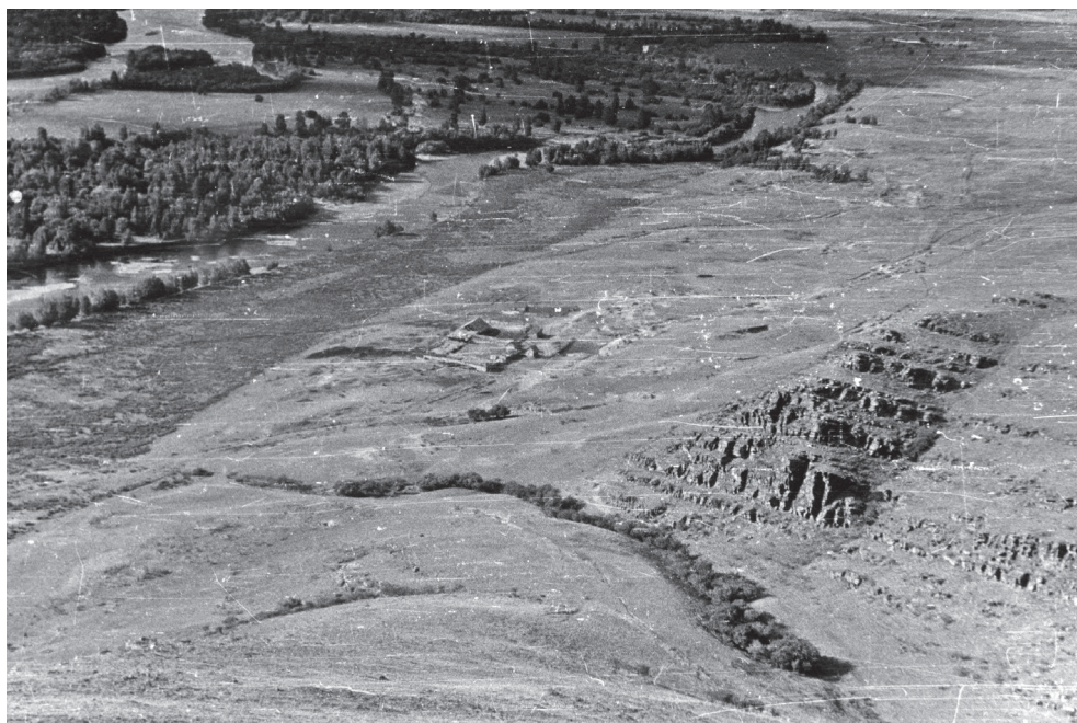
Рис. 1. Вид на могильное поле с кошарами у горы Тепсей. 1960-е гг.

Еще один населенный пункт, который располагался в непосредственной близости от горы Тепсей, — это поселок Усть-Туба. В настоящее время он затоплен, в 1960-е гг. его жители были переселены в Листвягово. К сожалению, сведения об этом населенном пункте и об их жителях практически отсутствуют, но, скорее всего, население в нем тоже было смешанным. Очевидно, что жители близлежащих населённых пунктов использовали тепсейские степи в качестве пастбищ, о чем свидетельствуют в настоящее время архивные фотографии и следы от кошар во внутренних логах горы Тепсей (рис. 1). На вершинах горных гряд Тепсея встречаются каменные обо [Бутанаев, 1996: 211] (рис. 2). Сама гора у местного населения считалась священной. Народное творчество местных жителей ярко отражено в наскальном искусстве. Местные «художники» использовали не только скальные поверхности, но и курганные камни и отдельные большие и малые плиты.