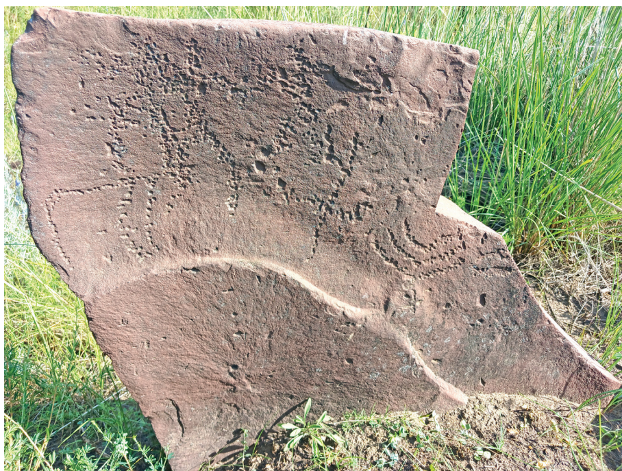
Рис. 4. Петроглифы на курганном камне. Тепсей VII

На другом камне из конструкции четырехкаменного тагарского кургана (пункт Тепсей VII) редкими округлыми выбоинами нанесена сцена, в которой запечатлены животное (олень), три антропоморфные фигуры и два тамгообразных знака (рис. 4).