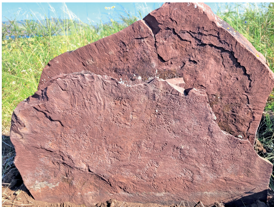
Рис. 3. Петроглифы на курганном камне. Тепсей VIII

Рассмотрим некоторые из наиболее выразительных сцен с изображениями, которые могут являться «поздними». На одном из камней конструкции восьмикаменного кургана, расположенного в пункте Тепсей VIII (по М. П. Грязнову) [Грязнов, Завитухина, Комарова, Миняев, Пшеницына, Худяков, 1979: 15–17], сосредоточено большое количество разнообразных тамг, а также несколько схематичных фигур животных (коней), дерева (?) (рис. 3).