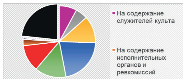
Рис. 2. Доля расходов Вознесенской церкви г. Улан-Удэ в период «перестройки» 12

Необходимо отметить, что расходы Вознесенской церкви увеличивались, составив в 1989 г. 237 тыс. руб. Самыми большими статьями расходов в процентном соотношении были «Прочие расходы» (24,5%) — траты на ремонт и содержание молитвенных зданий (22,6%), а также на приобретение предметов религиозного культа и литературы (14,7%).