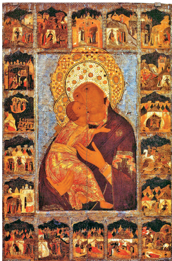
Рис. 3. Богоматерь Владимирская, с господскими и богородичными праздниками в 18-ти клеймах. Конец XVI в. Fig. 3. Our Lady of Vladimir, with Lord's and Mother of God's feasts in 18 scenes. Late 16th century

ле XVII в. по заказу Строгановых создан еще один список, выполненный знаменитым мастером Истомой Елизаровым. Особое почитание образа Владимирской иконы Божией матери Строгановыми подтверждается еще и обилием произведений лицевого шитья по иконографическому образцу древнего образа [Силкин, 1984]. Сам царь Иван Грозный почитал этот образ как главную святыню государства, создав целый цикл стихир — музыкально-гимнографических произведений, в честь этой чудотворной иконы [Парфентьев, Парфентьева, 2023: 291–321]. (Следует отметить, что царь возвышал образ Руси в своем музыкально-гимнографическом творчестве [Парфентьев, Парфентьева, 2020; 2022; 2023]). Прекрасный список иконы московского мастера олицетворял приверженность Строгановых конфессионально-государственной политике московских царей в период сложных исторических перипетий второй половины XVI — первой четверти XVII в. [Иконы строгановских вотчин XVI–XVII веков, 2003: 33, 53].