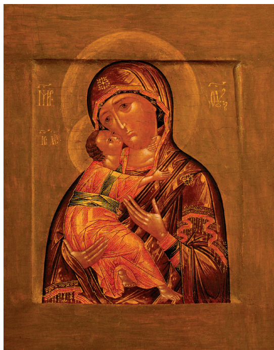
Рис. 1. Владимирская икона Богоматери, Елизаров Истома, первая четверть XVII в. Fig. 1. Our Lady of Vladimir, Elizarov Istoma, first quarter of the 17 th century