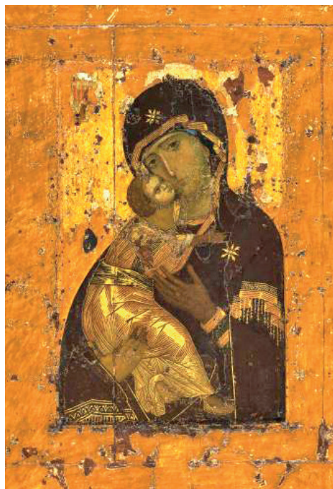
Рис. 2. Богоматерь Владимирская, Первая треть XII в. Fig. 2. Our Lady of Vladimir, first third of the 12 th century

Несмотря на проявление индивидуального вкуса, «строгановское» искусство создавалось в русле общероссийских тенденций своего времени. Например, Владимирская икона Строгановых — это отзвук Богоматери Владимирской из Успенского собора Московского Кремля, следование устоявшемуся византийскому канону (рис. 1–3). Первый список этой иконы из строгановского храма датируется XVI в. и отличается от подлинника тем, что там есть клейма, раскрывающие Господские и Богородичные праздники. Оригинальную Константинопольскую икону сын великого князя Юрия Долгорукого, князь Андрей Боголюбский привозит в Суздаль.