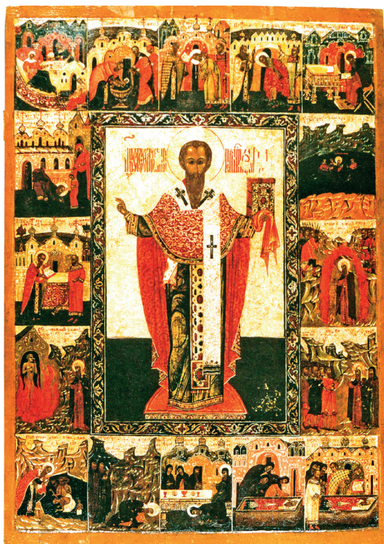
Рис. 6. Стефан Пермский, с житием в 16-ти клеймах. Первая половина XVII в.

тыми: молится у гроба митрополита Петра; беседует с Сергием Радонежским. Сцены жизни иллюстрируют проявления его святости: исцеление от слепоты царицы Ордынской Тайдулы при жизни, а после смерти — жены Матроны иконой; избавление женщины от недуга у гроба Алексия Митрополита и т.д. Жизненный путь святителя пришелся на тяжелое время монгольского ига, одной из его ключевых задач было объединение русских земель под началом церкви, защита интересов страны перед захватчиками. Клейма строгановской иконы демонстрируют поездки в Орду, где он пользовался почитанием, в том числе благодаря исцелению ханши Тайдулы (рис. 5). Алексий Митрополит был примером Строгановым не только как дипломат, но и ктитор, основавший храмы и монастыри, в том числе Чудов — часть Московского кремля. Таким образом, образ Алексия Митрополита олицетворяет святость, доступную как духовным лицам (чудеса исцеления), так и мирянам: защита страны и ее интересов, успешное ведение дипломатии, ктиторская деятельность.