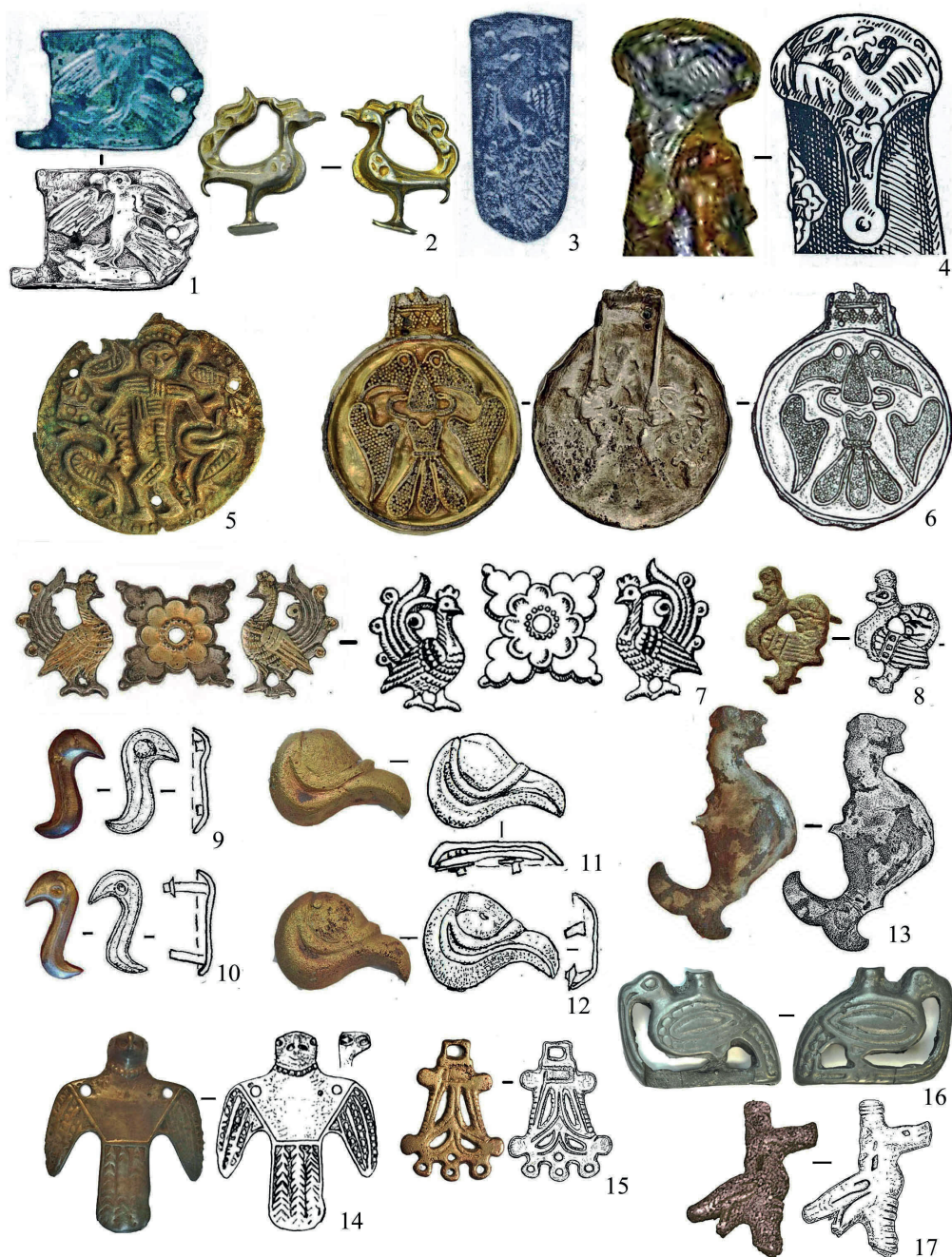
Рис. 3. Орнитологические сюжеты в мелкой металлопластике Урало-Поволжья IX–X вв.:

1 – Синеглазовский; 2, 6, 8–13 – Уелги; 3 – Пановский; 4 – Больше-Тиганский;