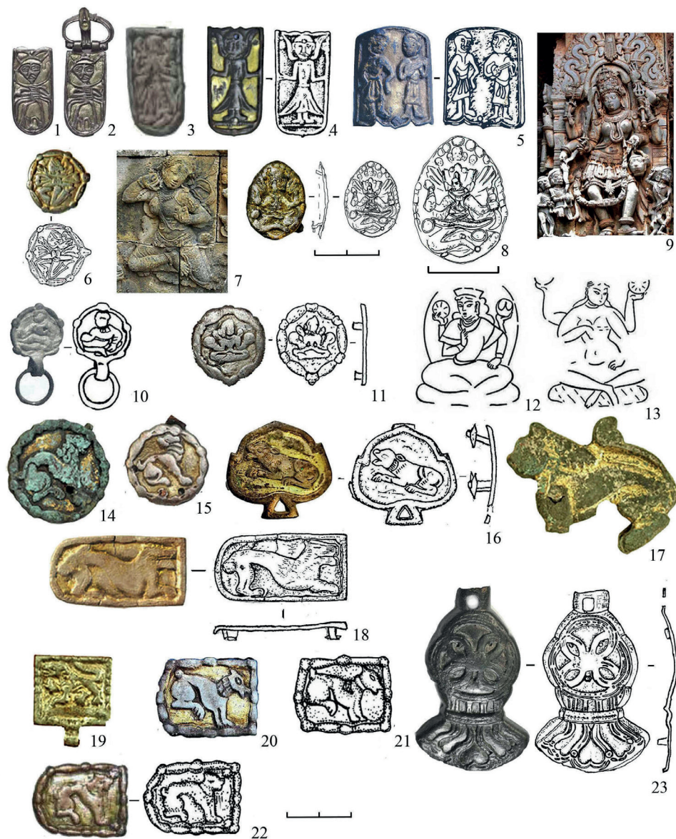
Рис. 2. Буддийская символика в урало-казахстанских памятниках IX–X вв.: 1–3 — Редикор (Пермский край); 4 — Ишимбаево (Башкортостан); 5 — Зевакинский могильник; 6 — Субботцы (Среднее Поднепровье); 7 — танцующие девы апсары (по: [Klima Laszlo, 2018: 147, fig. 6]), барельеф; 8, 11, 14–19 — погребальный комплекс Уелги; 9 — богиня Кали, Храм Хойсашвара, святилище Шантта лешвара, настенный барельеф; 10 — Баяновский