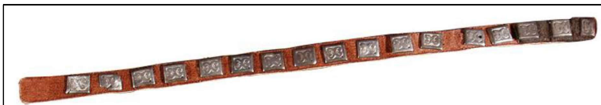
Рис. 1. Древнетюркский кожаный ремень с металлическими накладками VI–IX вв. Алтай

выше ранг воина (Степи Евразии, 1981, с. 74). Особая роль пояса в costume кочевника объясняется и тем, что некоторые пояса были именными, так наконечник пояса из восточносибирского кургана содержит надпись: «Хозяина (господина) Ак-кюна... кушак» (Степи Евразии, 1981, с. 41). На ремешках к поясу привешивалось оружие, мешочки с необходимыми в быту мелкими вещами – огнивом, оселком, оберегами и амулетами.