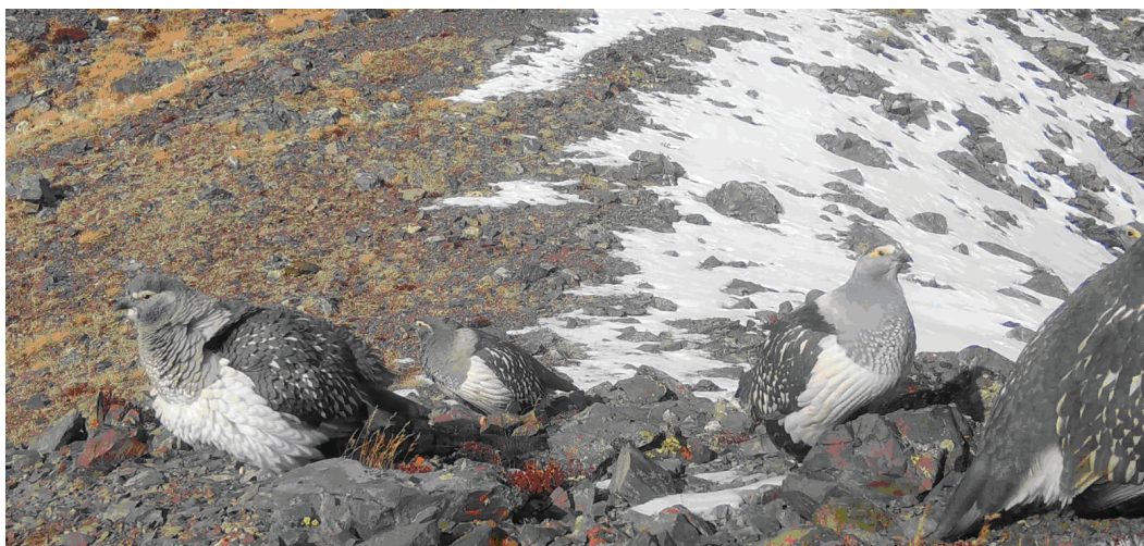
Рис. 1. Группа уларов в ур. Талдура, Южно-Чуйский хр., 16.09.2025.