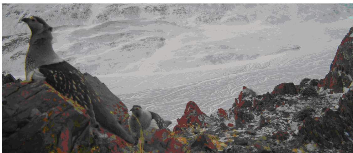
Рис. 3. Алтайские улары в районе р. Саржематы, 08.12.2025