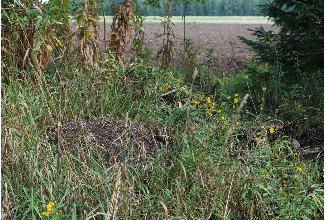
Figure 3. Гнездо муравьев Formica aquilonia Yar. на обочине поля агроландшафта МФ АФИ (дер. Меньково) в августе.