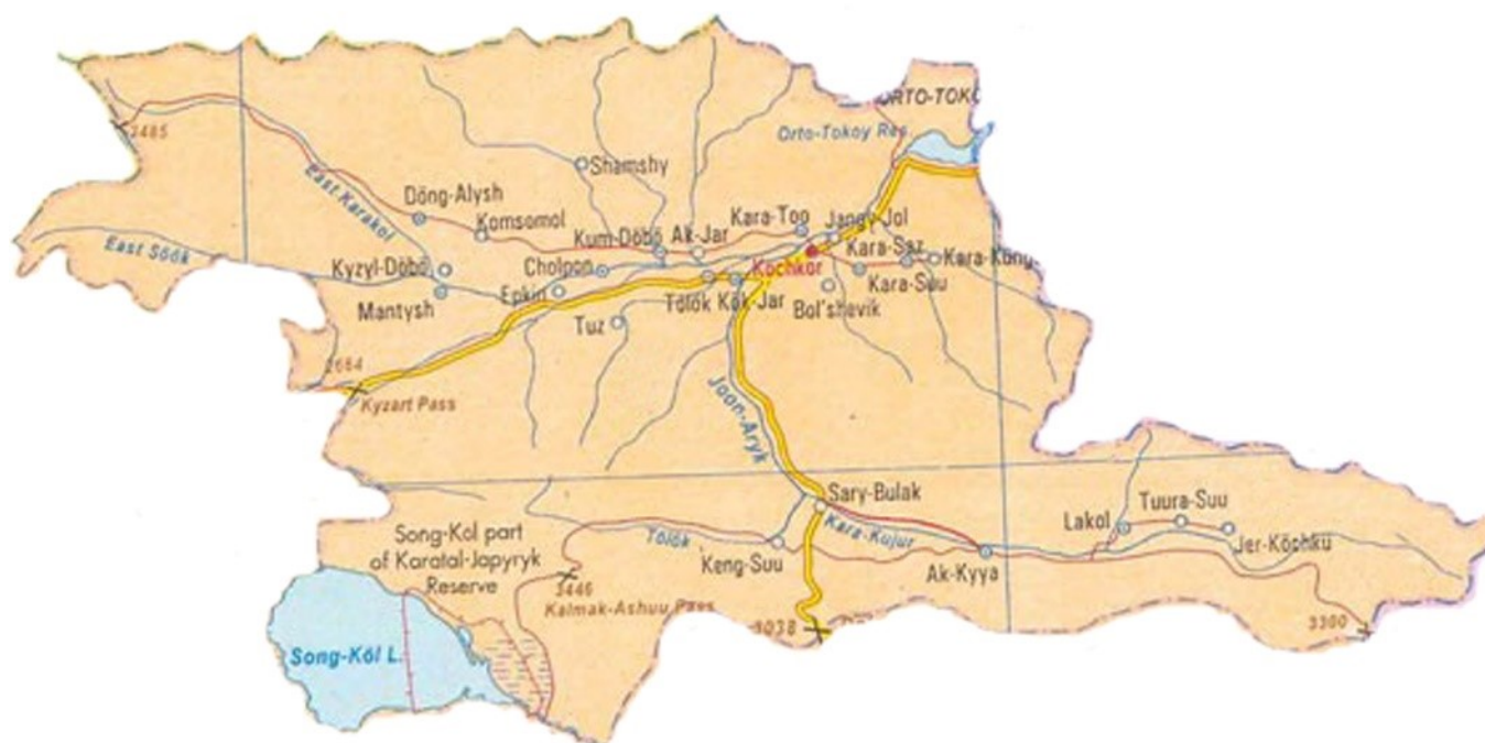
Figure 2. Карта Кочкорского района